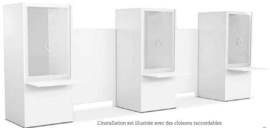
L'installation est illustrée avec des cloisons raccordables