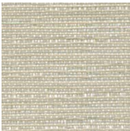
*TX74 Harmony Écru