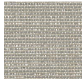
*TX61 Grain Drèche