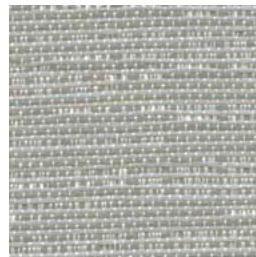
*TX76 Pebble Caillou