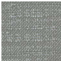
*TX69 Form Brume de mer