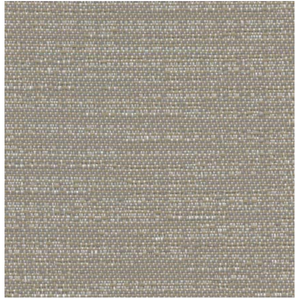
TX60 Finesse Voile cendré

100 % polyester recyclé de post-consommation