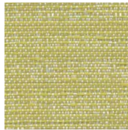
*TX73 Spring Livèche