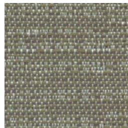
TX64 Warp Poussière d'étoile