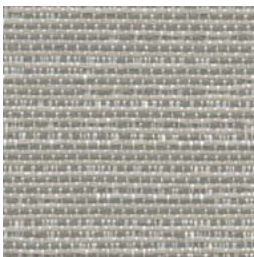
*TX67 Mesh Treillis