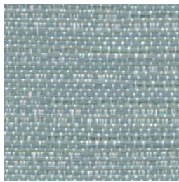
TX72 Glacier Névé