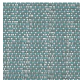
SR94 Splash Clapotis