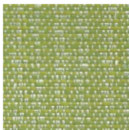
*SR95 Whiz Galop