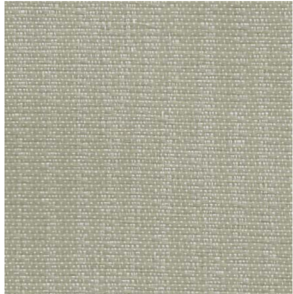
*SR89 Sprint Ruée

100 % polyester recyclé de post-consommation