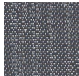
SR92 Dart Étrille