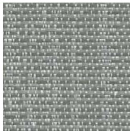
*SR88 Stretch Étrier