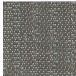
*SR81 Beach Estran