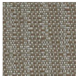
*SR91 Roll Trot