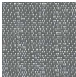
SR93 Zoom Foulée