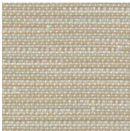
*LN43 Twine Ficelle