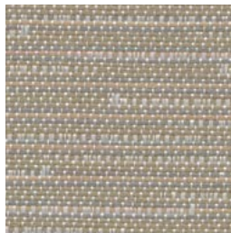
*LN42 Cord Corde