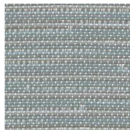
LN48 Route Tracé