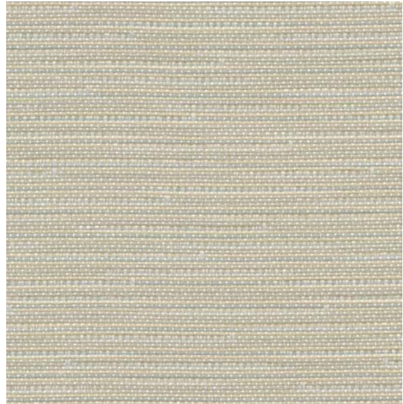
*LN44 Thread Fil

100 % polyester recyclé de post-consommation