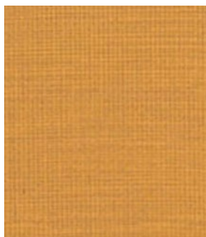
LE57 Sunset Couchant