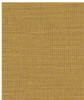
LE50 Potters Clay Argile