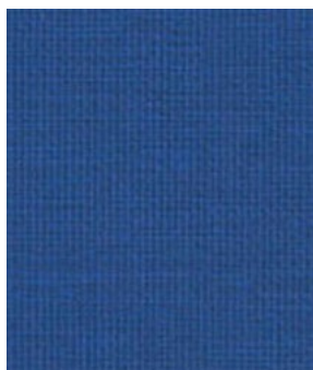
LE60 Navy Marine