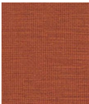
LE58 Burnt Orange Orange brûlé