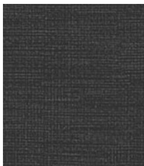
LE63 Charcoal Charbon