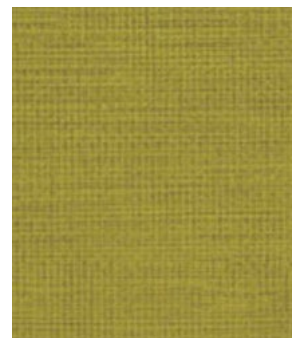
LE64 Moss Sphaigne