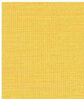
LE55 Haystack Foin