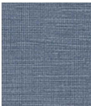
LE53 Storm Orage