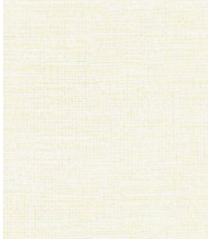
LE51 Pearl Perle