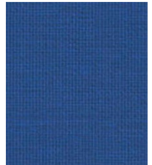
LE60 Navy Marine