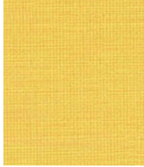
LE55 Haystack Foin