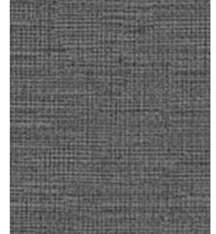
LE62 Gray Gris