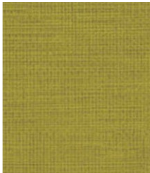
LE64 Moss Sphaigne