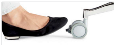
Les roulettes bloquantes pour planchers à moquette pivotent sur 360°