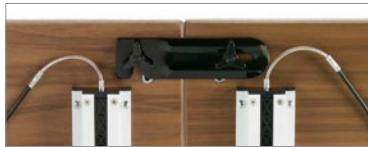
Des ferrures de jumelage sont offertes en option