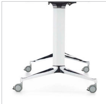
Les montants de pieds et les entretoises sont offerts dans une gamme complète de finis (fini blanc de blancs illustré). Le fini aluminium poli est de série pour le pied