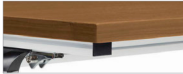
Les dessus de table sont offerts en placage dans un vaste choix de finis (fini café au lait sur noyer illustré)