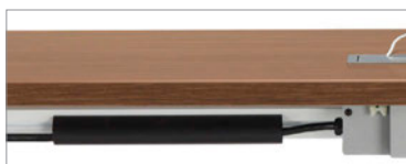
Un chemin de câbles encliquetable est offert en option