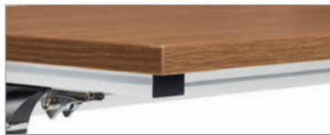
Les dessus de table sont aussi offerts dans un choix de finis mélaminés (fini brou illustré)