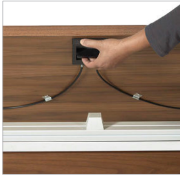
Le dessus se rabat d'une main