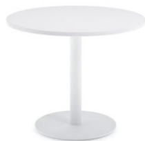
Blanc de blancs