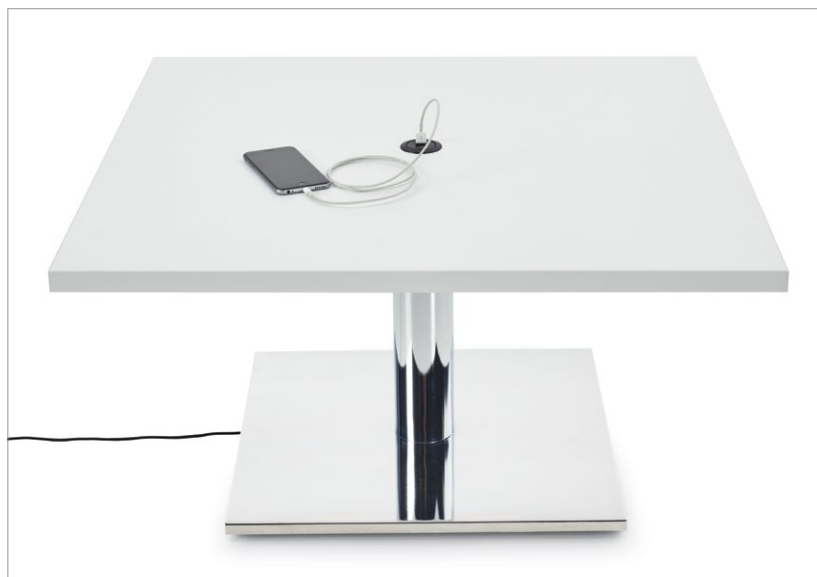
Gestion de l'alimentation dans certaines colonnes