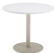
Café au lait