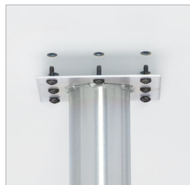
Douilles en métal installées en usine pour un raccord métal à métal facile