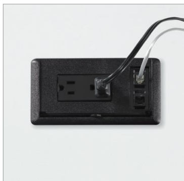
Modules d'alimentation électricité et données en option sur certains modèles