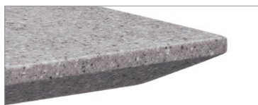
Dessus en surface solide et chant à arête vive