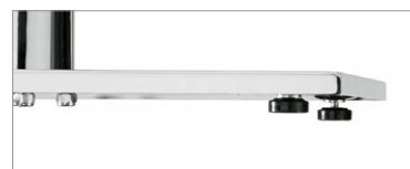
Patins réglables de série sur tous les piétements