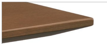
Dessus en placage et chant à arête vive en bois massif