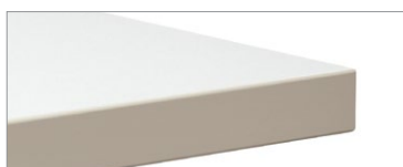
Dessus en mélamine thermosoudée et chant plat contrastant – fini café au lait illustré