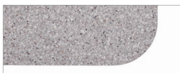
Des coins arrondis de 3 po sont offerts pour les dessus en surface solide (illustré), en stratifié haute pression et en mélamine thermosoudée