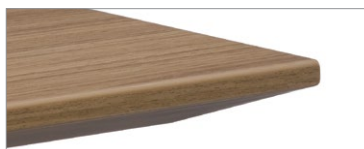
Dessus en stratifié haute pression et chant à arête vive agencé