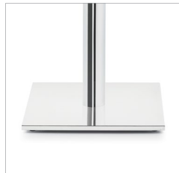
Plaques support circulaires ou carrées en acier de 1/2 po d'épaisseur