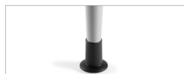
Pieds effilés munis de patins réglables en hauteur sur 1,5 po