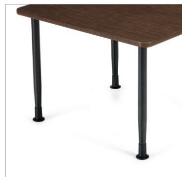
Les pieds en métal assurent une durabilité accrue