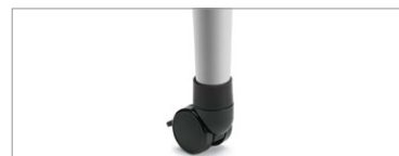
Pieds effilés munis de roulettes bloquantes

Pour plus de renseignements sur les produits, y compris les certifications environnementales et du secteur, visitez globalfurnituregroup.com .