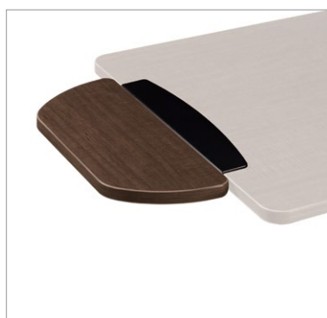
La tablette à hauteur fixe pour les tables de salle à manger offre plus d'espace pour les jambes pour les personnes en fauteuil roulant