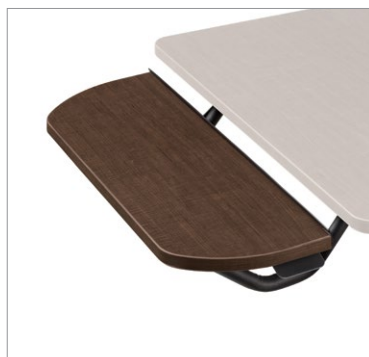
La tablette à deux bras E-Z Lift pour la gamme de tables Enable se règle en hauteur