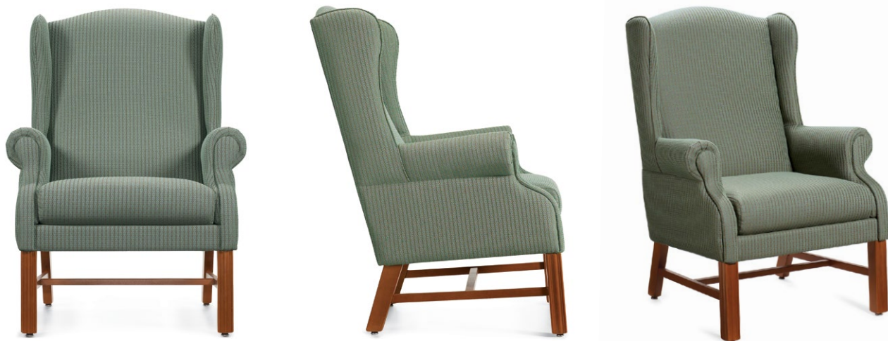
Bergère à dossier haut

D'une élégance intemporelle, la gamme Wingback MC se distingue notamment par ses dimensions compactes qui en font un choix idéal pour le salon, le hall d'entrée, la chambre de patient ou tout espace commun. Mise au point en consultation avec des intervenants de premier plan du secteur des soins de santé, la bergère Wingback a été conçue avec soin pour répondre aux besoins du milieu des soins de santé et des lieux de résidence pour aînés. La hauteur du dossier, la hauteur des accoudoirs, la taille des oreilles et le soutien lombaire ont été modifiés pour mieux s'adapter à l'utilisateur, éliminant les barrières communes des modèles plus imposants.