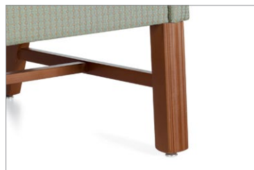
Le pied de style Chippendale est offert dans tous les finis bois de Global

Pour plus de renseignements sur les produits, y compris les certifications environnementales et du secteur, visitez globalfurnituregroup.com .