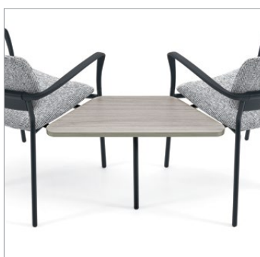
Table jumelable de coin 120°

Willow allie confort et durabilité à la polyvalence d'une gamme de sièges modulaires. Les sièges individuels peuvent être jumelés entre eux ou avec des tables de coin, intermédiaires ou de bout selon les besoins pour créer un aménagement qui convient à l'espace.