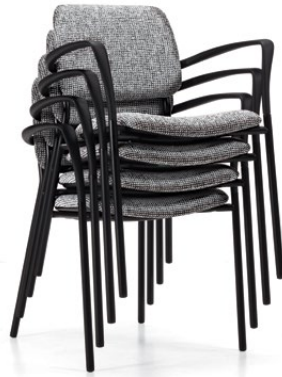
On peut empiler 4 sièges rembourrés au sol On peut empiler 6 sièges non rembourrés au sol