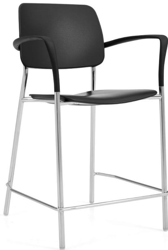
Tabouret de comptoir, assise et dossier en polypropylène

Le vaste éventail de modèles, de finis et d'options de rembourrage de la gamme Willow offre d'innombrables possibilités créatives. Polyvalents et empilables, les sièges Willow se glissent vraiment partout et conviennent à merveille pour l'entreprise, les milieux éducatifs et bien plus encore.