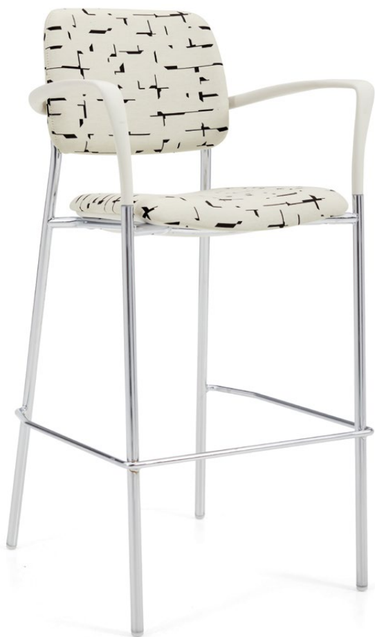
Tabouret de bar, assise et dossier rembourrés