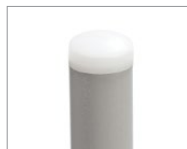
Nylon ne marquant pas