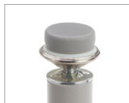
À coussinet en caoutchouc