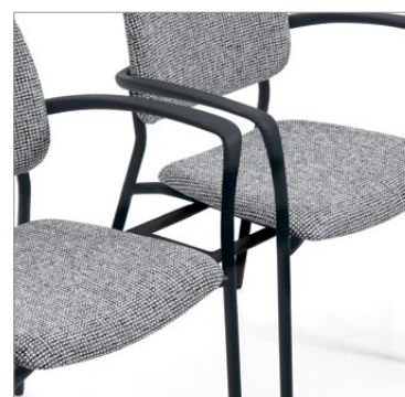
Brides de jumelage