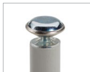
À coussinet en acier