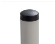
Nylon de couleur (noir ou sable)