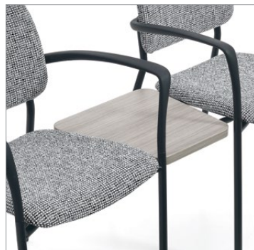
Table jumelable intermédiaire de 16 po

Tables jumelables, brides de jumelage et alimentation