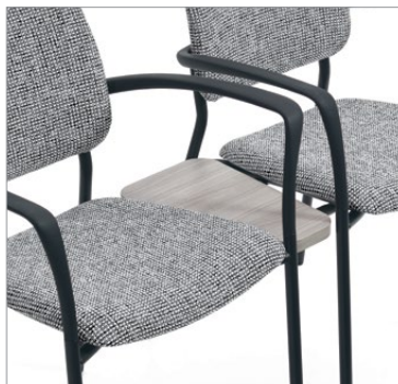
Table jumelable intermédiaire de 9 po