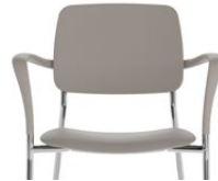
Café au lait