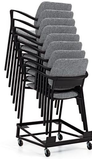
On peut empiler 8 sièges rembourrés sur le chariot On peut empiler 10 sièges non rembourrés sur le chariot