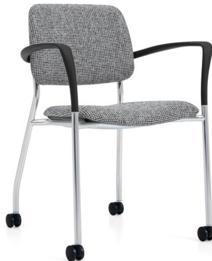
Fauteuil sur roulettes, assise et dossier rembourrés

En haut : Le siège de gauche présente un bâti fini noir et une assise et un dossier finis nocturne; le siège de droite présente un bâti noir, l'assise et le dossier rembourrés sont garnis d'un textile Macrotweed de LUUM en frêne blanc.