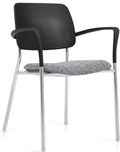
Fauteuil, assise rembourrée et dossier en polypropylène