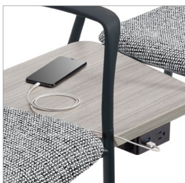
Module d'alimentation électrique + USB à monter sous la surface en option