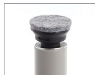
À coussinet en feutre