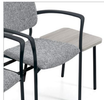
Table jumelable de bout