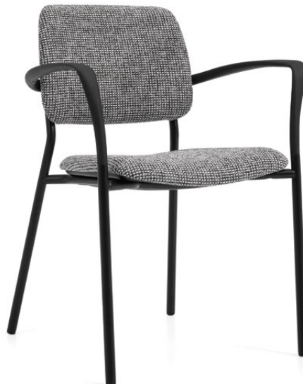
Fauteuil, assise et dossier rembourrés