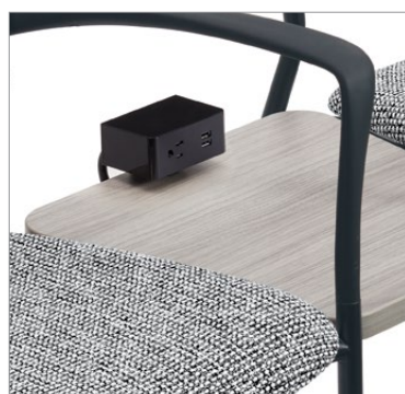
Module d'alimentation électrique + USB à montage par pince en option