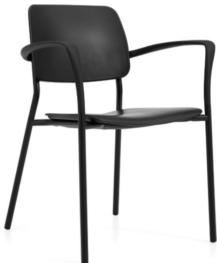
Fauteuil, assise et dossier en polypropylène