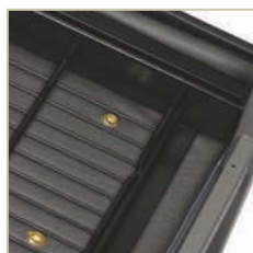
Les coussins d'assise amovibles facilitent le nettoyage et le remplacement.