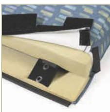
Le tissu d'ameublement amovible facilite le nettoyage et le remplacement.