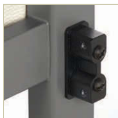
Les raccords métal sur métal permettent une connexion robuste de longue durée.