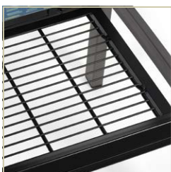
Plateau d'assise en treillis métallique pour faciliter l'écoulement en cas d'incontinence.