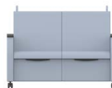
FAUTEUIL-LIT DOUBLE GC3612 Manchons en uréthane