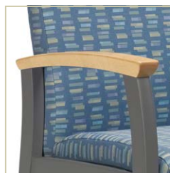
Manchons en bois offerts dans un choix de finis.