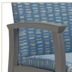
Manchons en uréthane offerts en plusieurs couleurs.