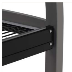
Raccords métal à métal pour plus de robustesse et une vie utile prolongée.