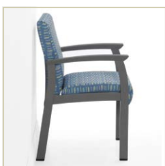
Pieds protège-mur permettant de protéger à la fois le mur et le dossier du siège.