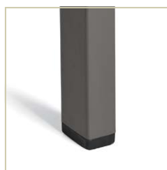
Patins durables non marquants.