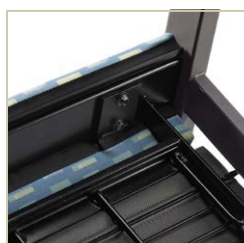
Fixations faciles d'accès permettant de retirer le dossier rapidement.