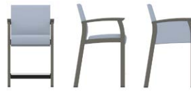
FAUTEUIL À ASSISE ÉLEVÉE À DOSSIER BAS GC3636 Accoudoirs à joue ouverte GC3636CA Accoudoirs à joue pleine