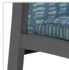
Bâti en acier rigide, procédé de soudage MIG.