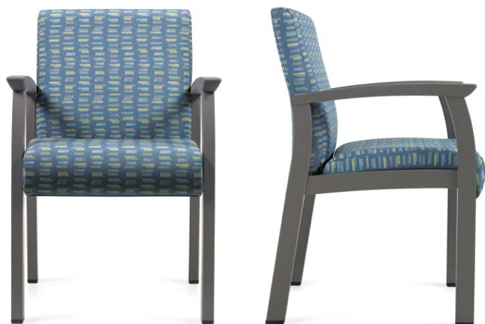
GC3631 Fauteuil patient à dossier moyen avec accoudoirs à joue ouverte et manchons en uréthane.

La version à bâti en acier de la très populaire gamme de sièges Primacare, Primacare HT propose une robustesse supérieure qui répond aux exigences des milieux à fort trafic tout en s'agencant visuellement à la gamme Primacare originale à bâti en bois. Ensemble, elles offrent une solution simple et intégrée.