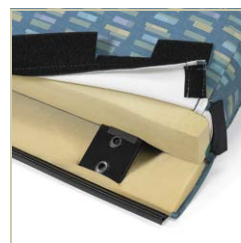
Coussins de dossier et housses amovibles et remplaçables pour faciliter l'entretien.