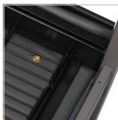
Coussins d'assise et housses amovibles et remplaçables pour faciliter l'entretien.