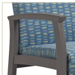
Accoudoirs à joue ouverte.

Ensemble, Primacare et Primacare HT offrent la solution intégrée la plus complète pour les établissements de soins de courte durée ou de services aux aînés et la « solution idéale » pour les cliniques, la salle d'urgence, d'attente ou de traitement, la chambre de patient, la salle à manger ou le coin salon.