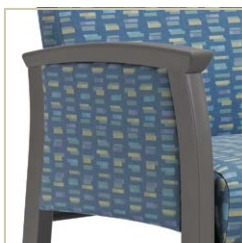
Accoudoirs à joue pleine entièrement rembourrée.