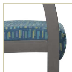
Coussin d'assise à devant semi-arrondi.