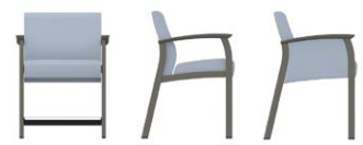
FAUTEUIL, ASSISE À 24 PO DE HAUTEUR GC3657 Accoudoirs à joue ouverte GC3657CA Accoudoirs à joue pleine