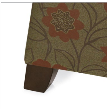
Pieds en bois – offerts dans tous les finis bois pour soins de santé de Global