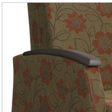
Manchons en uréthane – offerts dans tous les finis uréthane pour soins de santé de Global