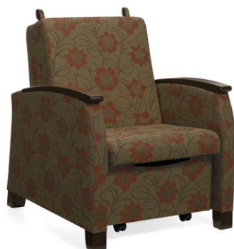
Fauteuil-lit simple Primacare