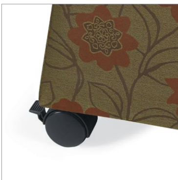
Des modèles sont munis de série de roulettes noires de 3 po à doubles galets pour planchers à revêtement dur