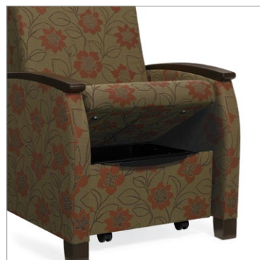
Rangement – compartiments de rangement aérés sous le coussin d'assise

Pour plus de renseignements sur les produits, y compris les certifications environnementales et du secteur, visitez globalfurnituregroup.com .