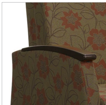
Manchons en bois – offerts dans tous les finis bois pour soins de santé de Global