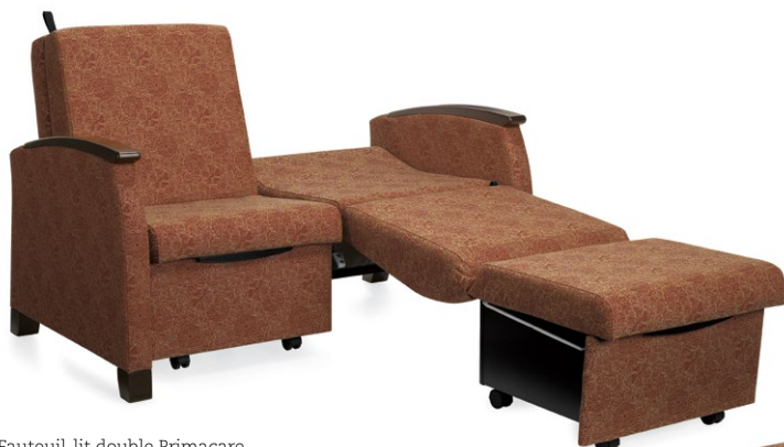
Fauteuil-lit double Primacare