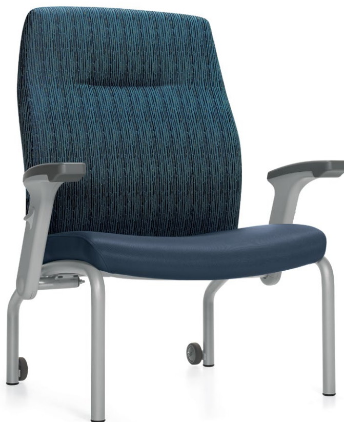
Fauteuil bariatrique de patient à dossier haut

La gamme Nourish MC a été mise au point avec le concours de professionnels chevronnés du domaine des soins de santé. La gamme propose des sièges novateurs à la fine pointe de la technologie qui se distinguent par des caractéristiques particulières adaptées à la morphologie et au degré de mobilité du patient. Pour faciliter le transfert en toute sécurité, chaque accoudoir peut s'escamoter, permettant un déplacement horizontal d'une surface à une autre, par exemple du lit au fauteuil, ou vice versa.