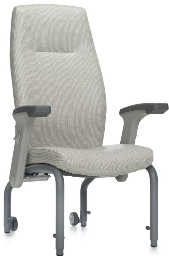
Fauteuil de patient à dossier haut avec support lombaire et appui-tête Schukra