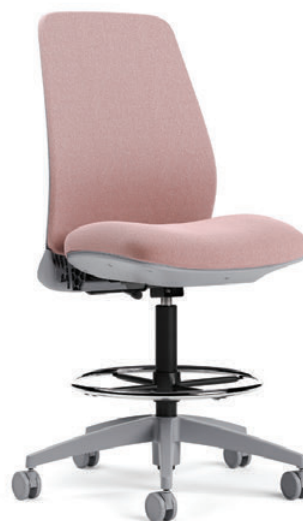
Tabouret sans accoudoirs à dossier rembourré, hauteur réglable, fonctionnel pivotant de base

La gamme Noetic propose un éventail de sièges de travail, trois choix de mécanismes, des modèles à dossier en tissu maillé ou rembourré, et des modèles avec ou sans accoudoirs. Un réglage de la hauteur du dossier, de la profondeur de l'assise et des accoudoirs permet d'adapter le siège en fonction de la taille de l'utilisateur et de ses préférences.