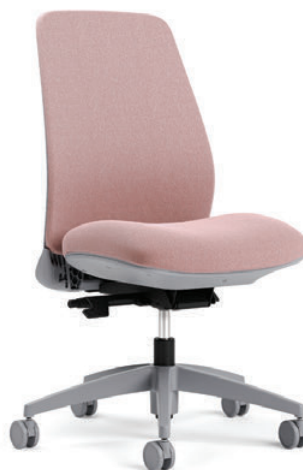
Chaise à dossier rembourré, basculement synchro avec capteur de poids