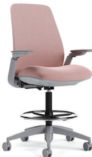
Tabouret à dossier rembourré, hauteur réglable, fonctionnel pivotant de base

Les sièges présentent un bâti fini brume, une assise garnie d'un textile Everywhere Texture de DesignTex en douceur et un dossier en tissu maillé Dimension en brouillard ou un dossier garni d'un textile Everywhere Texture de DesignTex en douceur.