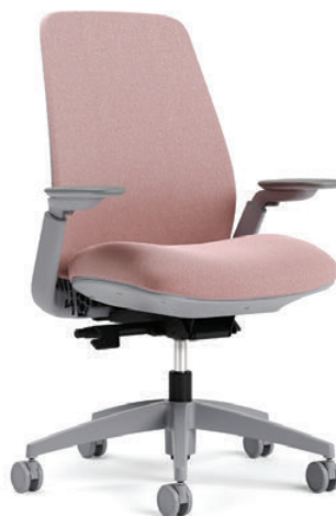
Fauteuil à dossier rembourré, basculement synchro avec capteur de poids