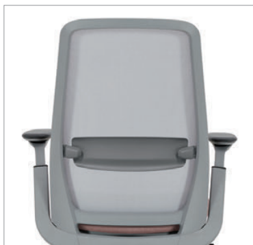
Les modèles à dossier en tissu maillé sont offerts en tissu maillé Digital ou Dimension