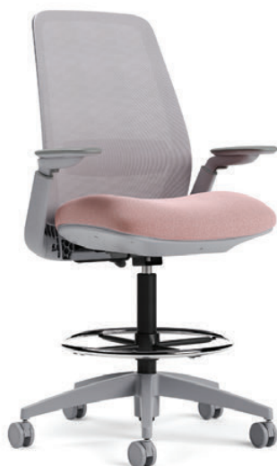
Tabouret à dossier en tissu maillé, hauteur réglable, fonctionnel pivotant de base