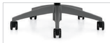
Piètement ombre et roulettes noires