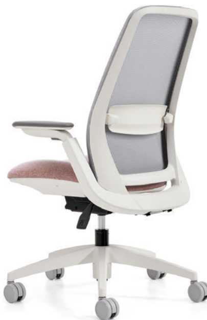
Bâti et piétement finis stratus

Personnalisez votre siège Noetic en choisissant parmi les sept teintes du tissu maillé Dimension et les six teintes du tissu maillé Digital. À cela s'ajoutent quatre finis pour le bâti, des accoudoirs et des piétements assortis, et un vaste choix de textiles fichés de Global et de partenaires de l'Alliance textile.