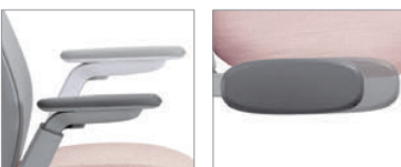
Les accoudoirs à hauteur réglable 2D sont dotés de manchons qui coulissent vers l'avant et vers l'arrière