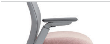
Deux choix d'accoudoirs à hauteur réglable (2D et 4D)