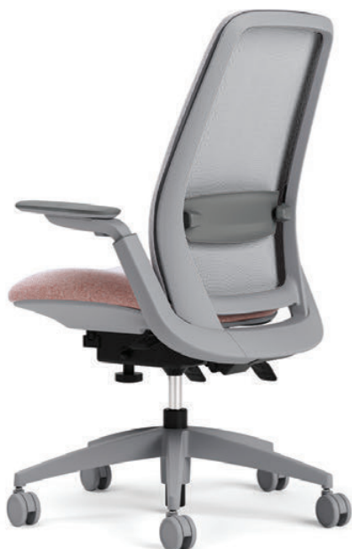
Bâti et piétement finis brume