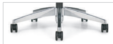
Piètement aluminium poli et roulettes noires

Pour plus de renseignements sur les produits, y compris les certifications environnementales et du secteur, visitez globalfurnituregroup.com .