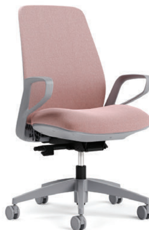
Fauteuil à dossier rembourré, basculement synchro avec capteur de poids