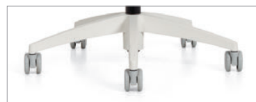
Piètement stratus et roulettes brume