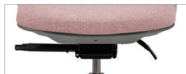
Basculement synchronisé avec capteur de poids