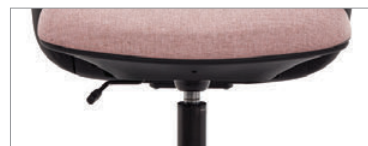
Fonctionnel pivotant de base