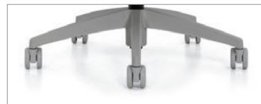
Piètement brume et roulettes brume