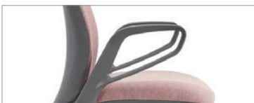
Accoudoirs en P à hauteur fixe