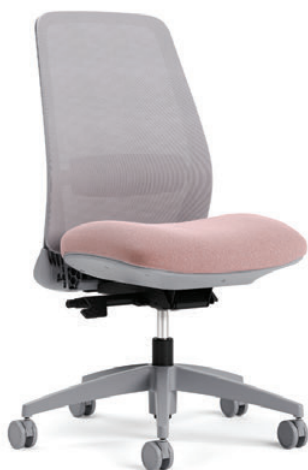
Chaise à dossier en tissu maillé, basculement synchro avec capteur de poids