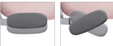
Les accoudoirs à hauteur réglable 4D sont dotés de manchons pivotants qui coulissent vers l'avant, vers l'arrière et latéralement