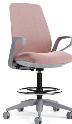
Tabouret à dossier rembourré, hauteur réglable, fonctionnel pivotant de base

Les tabourets de comptoir et de bar à hauteur réglable conviennent autant pour le milieu éducatif qu'en milieu du travail. Certifiée GREENGUARD Or et BIFMA LEVEL 3, la gamme Noetic est protégée par la garantie limitée à vie de Global.