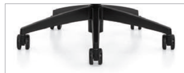
Piètement noir et roulettes noires