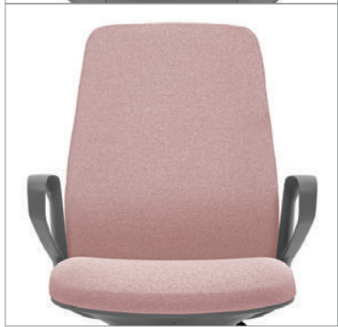
Modèles à dossier rembourré : le tissu maillé Dimension à l'extérieur du dossier s'agence avec la couleur choisie pour le bâti