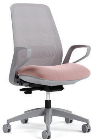
Fauteuil à dossier en tissu maillé, basculement synchro avec capteur de poids