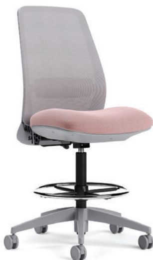
Tabouret sans accoudoirs à dossier en tissu maillé, hauteur réglable, fonctionnel pivotant de base