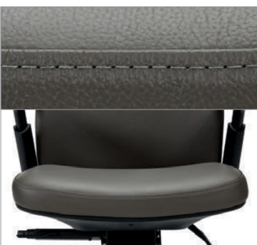
Le périmètre des assises garnies d'un textile enduit ou d'un cuir est rehaussé par des surpiqûres