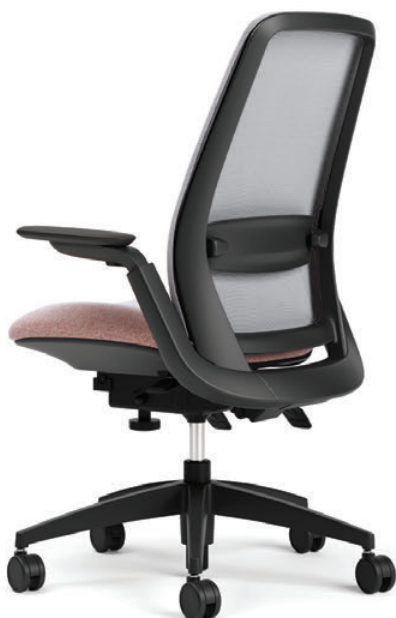
Bâti et piétement finis noirs