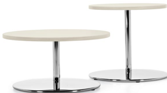
Table de salon circulaire et table de bout circulaire