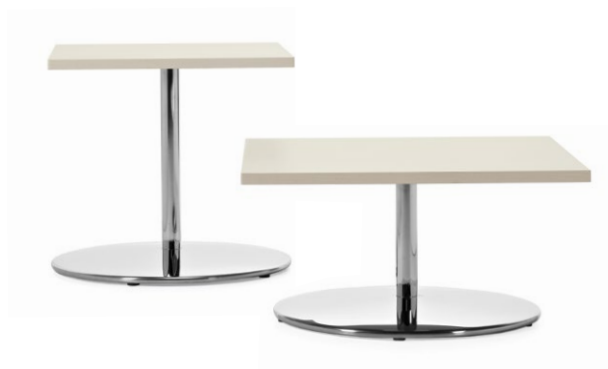
Table de bout carrée et table de salon carrée

Vous trouverez un complément d'information sur le site Web de Global.