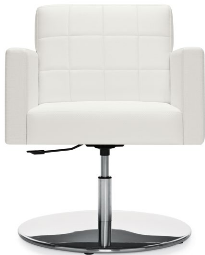
Fauteuil club à autocentrage sur base piédestal à hauteur réglable