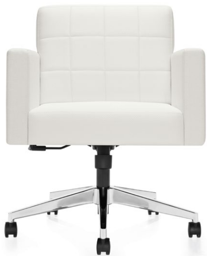
Fauteuil basculant pivotant sur piétement à cinq branches