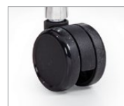
Roulettes pour planchers à moquette