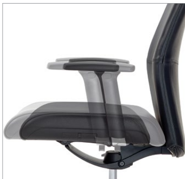
Assise sur coulisse