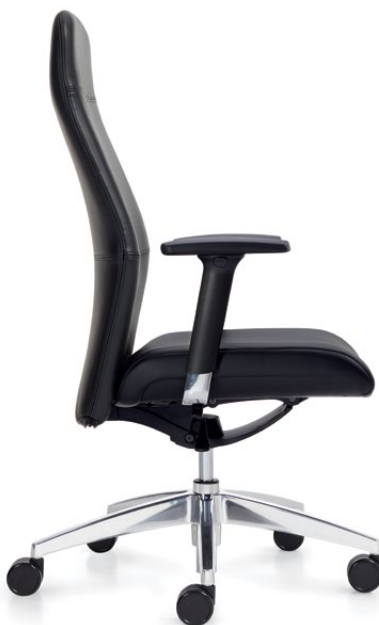
Fauteuil à dossier haut, accoudoirs à hauteur et à écartement réglables