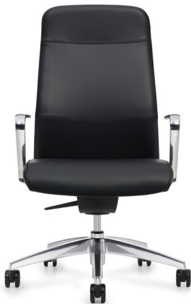
Fauteuil à dossier haut, accoudoirs à hauteur fixe