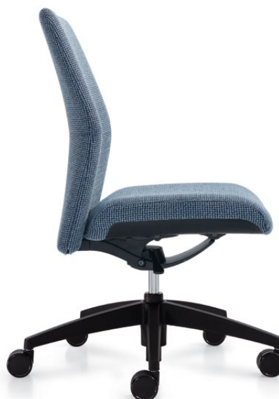
Chaise à dossier moyen

Le cylindre de levage à gaz de 4 po permet de régler la hauteur du siège de 17 po à 21 po tout en maintenant les accoudoirs à une hauteur maximale de 27 po (accoudoirs en porte-à-faux) pour permettre au siège de se glisser aisément sous une table. Le piétement est offert en nylon noir ou en aluminium poli (en option) pour s'agencer au fini aluminium poli des accoudoirs en porte-à-faux à hauteur fixe en aluminium poli et aux détails verticaux des accoudoirs à hauteur réglable.