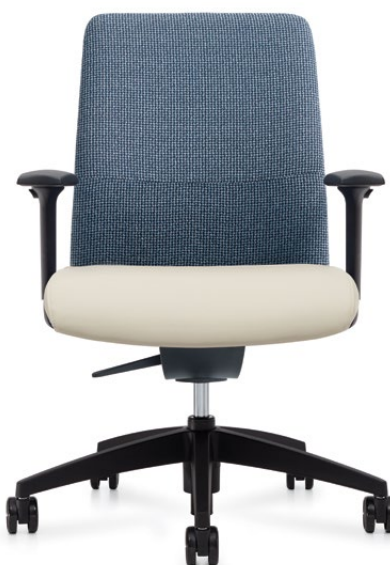
Fauteuil à dossier moyen, accoudoirs à hauteur et à écartement réglables