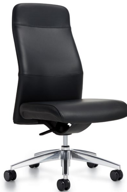
Chaise à dossier haut