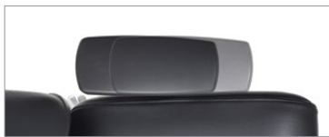
Manchons coulissant vers l'avant et vers l'arrière