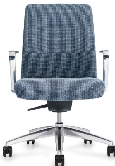
Fauteuil à dossier moyen, accoudoirs à hauteur fixe