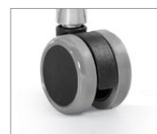
Roulettes pour planchers à revêtement dur

Pour plus de renseignements sur les produits, y compris les certifications environnementales et du secteur, visitez globalfurnituregroup.com .