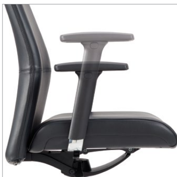
Accoudoirs à hauteur réglable