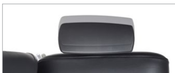
Accoudoirs à écartement réglable