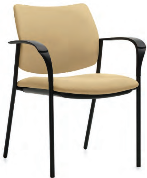
Piètement à quatre pieds