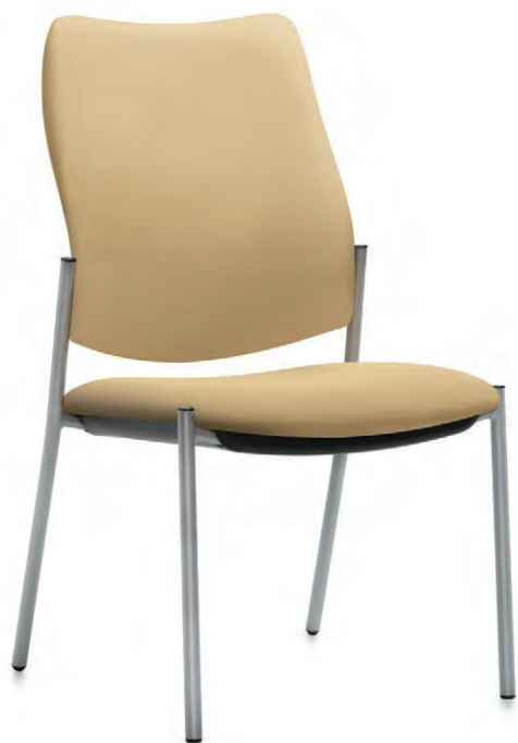
Chaise à dossier haut, quatre pieds