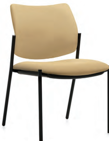
Chaise à dossier bas, quatre pieds