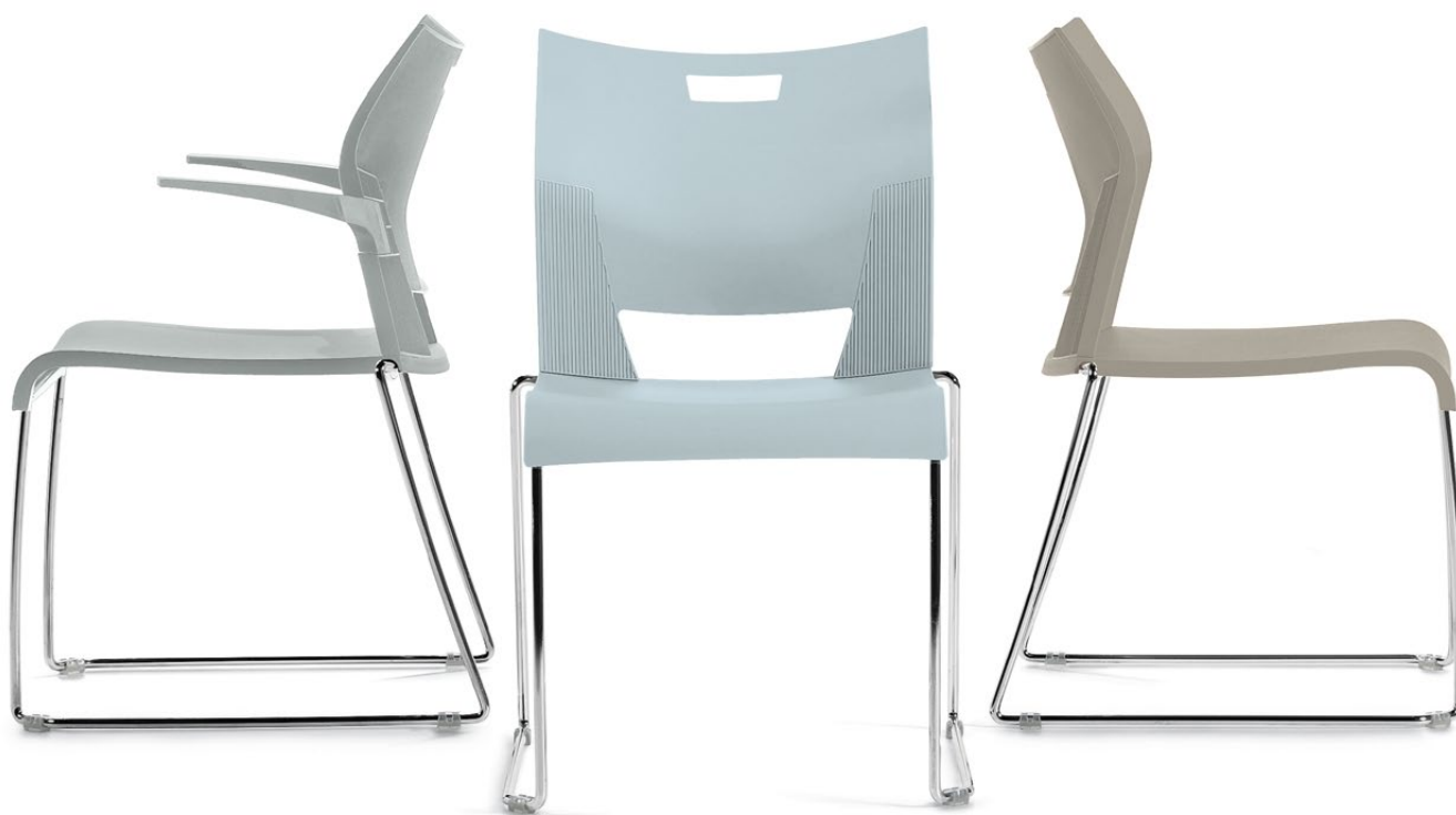
Tons neutres pâles

Duet MC – un siège polyvalent, empilable en grand nombre, d'une prestance incontestée, qui trouve sa place aussi bien en solo autour d'une table que jumelé en rangées bien droites et ordonnées. On peut de plus empiler, transporter ou ranger jusqu'à 40 sièges Duet sur un chariot. La gamme se décline en une palette de teintes contemporaines – à vous de choisir vos préférées.