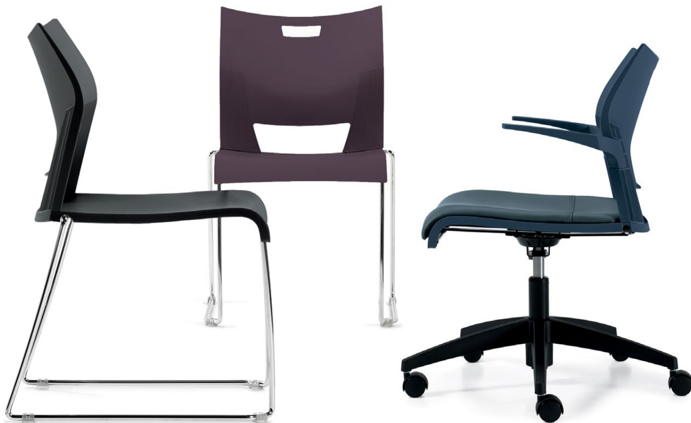
Tons neutres foncés

Protégés par la garantie à vie de Global, le bâti en acier robuste et l'assise et le dossier en polymère résistant sont conçus pour durer. Les sièges Duet sont fabriqués en Amérique du Nord dans des installations ISO 14001.