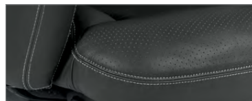
Surpiqûres contrastantes réalisées avec un fil épais