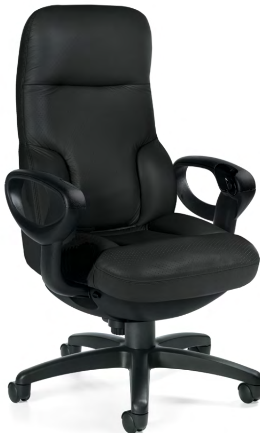
Fauteuil à basculement synchro à dossier haut Concorde Executive 24 h

La gamme Concorde place des commandes actionnées par boutons-poussoirs à portée de la main, dans les accoudoirs des sièges. Il suffit d'appuyer sur un bouton pour faire basculer le siège librement; appuyez à nouveau et il se bloque fermement dans la position assise souhaitée. Le nec plus ultra des fauteuils de direction, le modèle Presidential propose une assise plus large offrant un soutien amélioré, un dossier haut et des surpiqûres contrastantes.