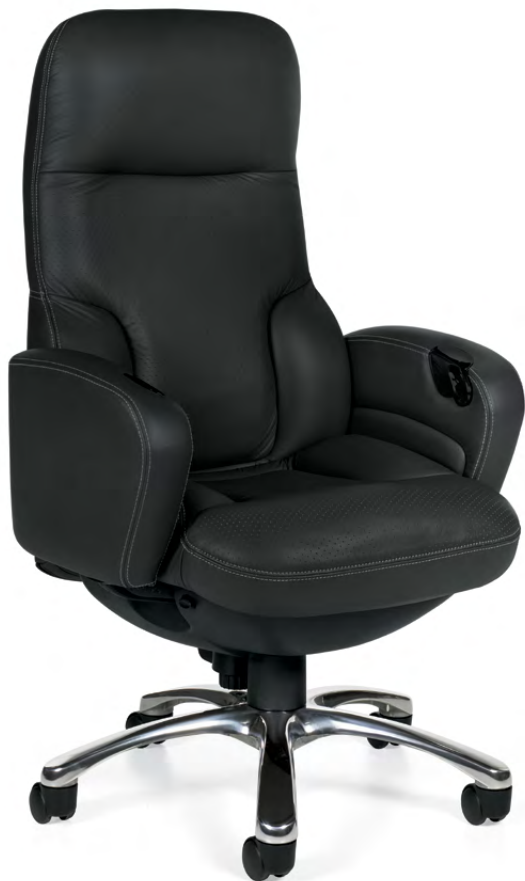
Fauteuil à basculement synchro à dossier haut Concorde Presidential de luxe