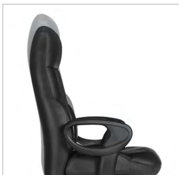
Réglage de la hauteur du dossier