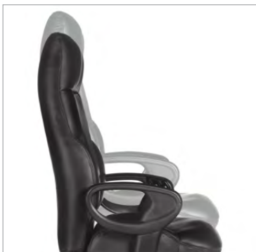
Réglage de la hauteur du siège