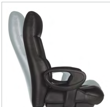
Blocage du basculement