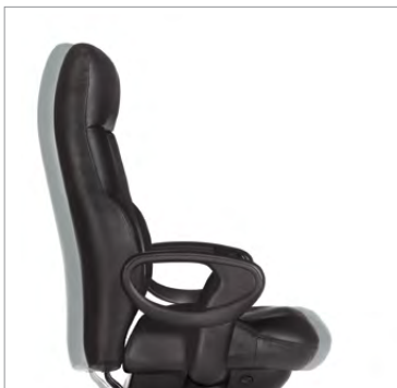
Mécanisme sur coulisse de réglage de la profondeur de l'assise