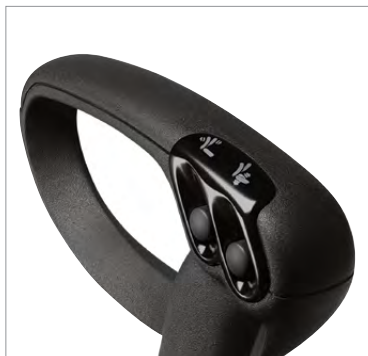
Commandes actionnées par boutons-poussoirs situés à portée de la main dans les accoudoirs