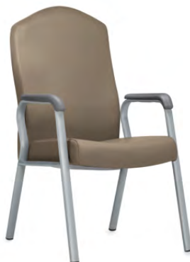
Fauteuil à dossier haut flexible (assise à 20 po du sol)