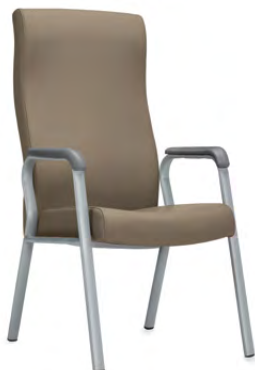
Fauteuil à dossier haut profilé flexible à dessus droit