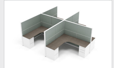
Option 3 • 2 806,00 $ EVPCEPS424 • x1 EVPCEPSA324 • x1 EVPEERSA24 • x5 EVPFE2436 • x12 EVPIECS24 • x6