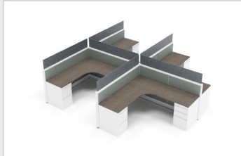
Option 2 • 888,00 $ EVFDK1236P • x12