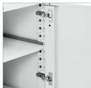
Détail des charnières et de l'intérieur

Les armoires de rangement sont offertes dans tous les finis de série et texturés de Global. Des couleurs métalliques et hors série sont offertes, moyennant un supplément. Veuillez consulter notre site Web ou la liste de prix Classement + rangement en métal pour de plus amples renseignements.