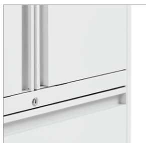
Détails des poignées et devants