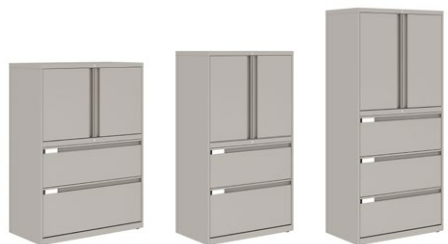
GUCC41G18xxP Armoire hauteur 4 tiroirs