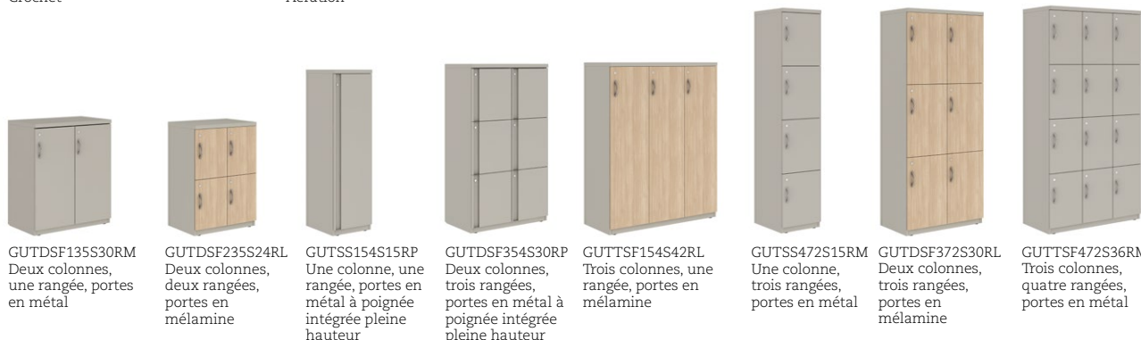
GUTDSF135S30RM Deux colonnes, une rangée, portes en métal

Les casiers sont offerts dans tous les finis de série et texturés de Global. Des couleurs métalliques et hors série sont offertes, moyennant un supplément. Veuillez consulter notre site Web ou la liste de prix Classement + rangement en métal pour de plus amples renseignements.